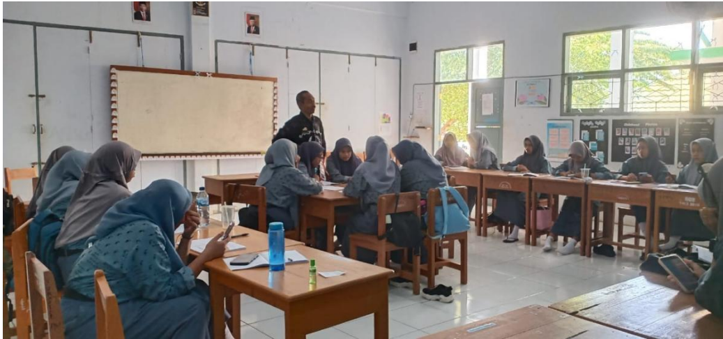
Proses diskusi untuk menetapkan kesepakatan kelas, guru memandu beberapa point penting