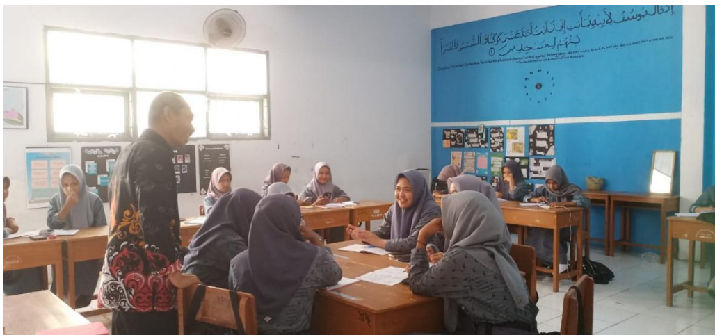
Guru memandu beberapa point penting dan siswa merasa dihargai atas beberapa point penting yang disampaikan