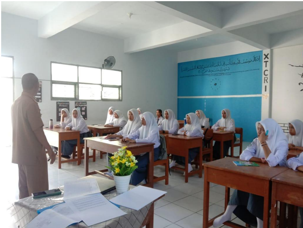
Guru mempersamai siswa dlm proses pelibatan perancangan pelaksanaan P5 (proyek penguatan profil pelajar Pancasila) dengan tema Kebekerjaan