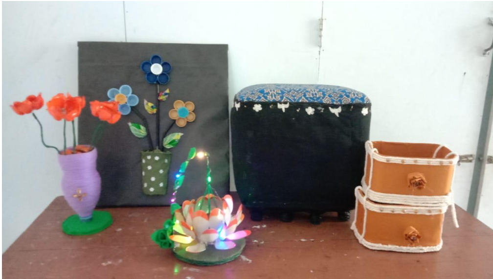
Hasil produk P5 siswa