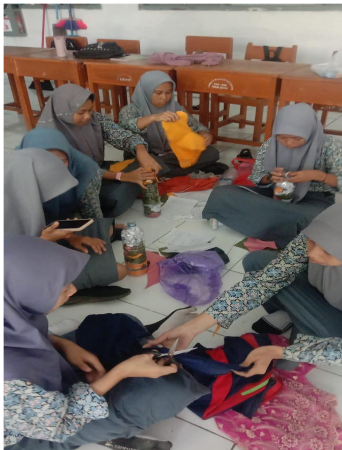
Proses pembuatan produk P5 sesuai kesepakatan dan minat siswa