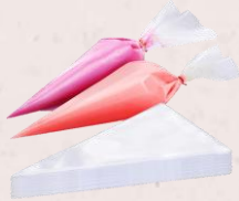
8. Paping Bag