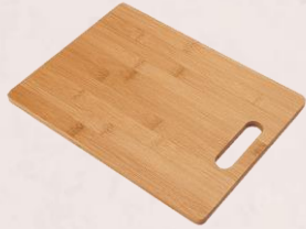
2. Cutting Board