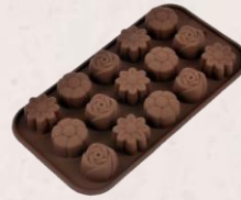
9. Cetakan Praline