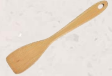
5. Wooden Spatula