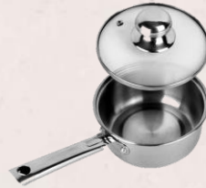
4. Sauce Pan